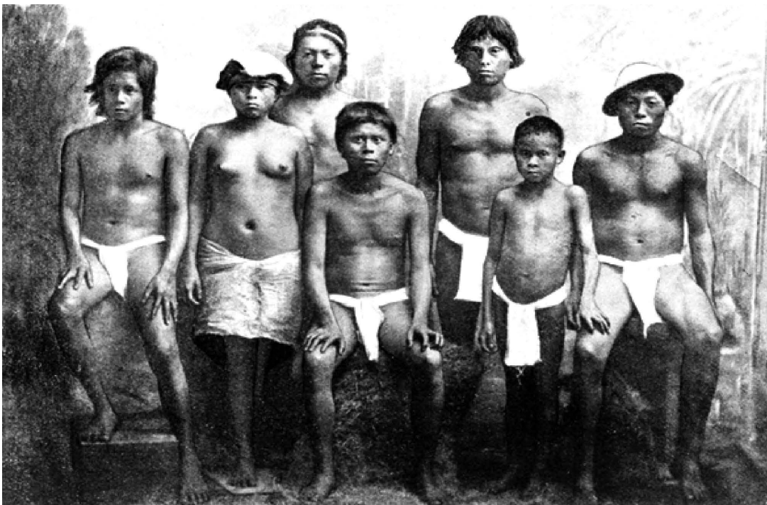
Misioneros moravos de la Mosquitia en Nicaragua.