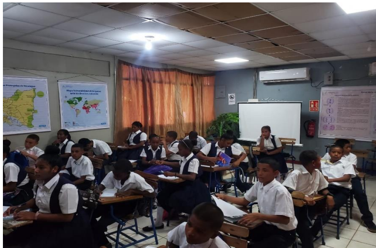
Estudiantado Resolviendo Prueba Diagnóstica.