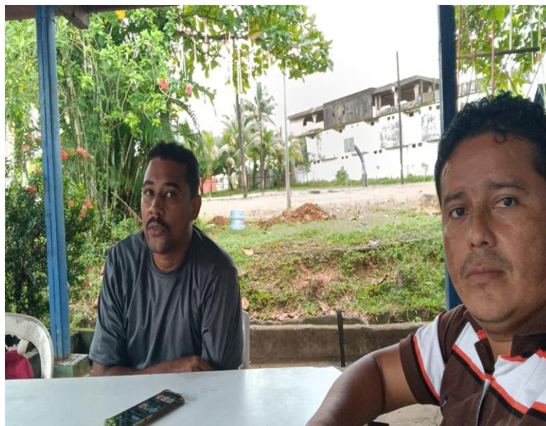
Encuentro de Docentes investigadores, aplicando el Plan de Acción con estudiantes del 7mo grado