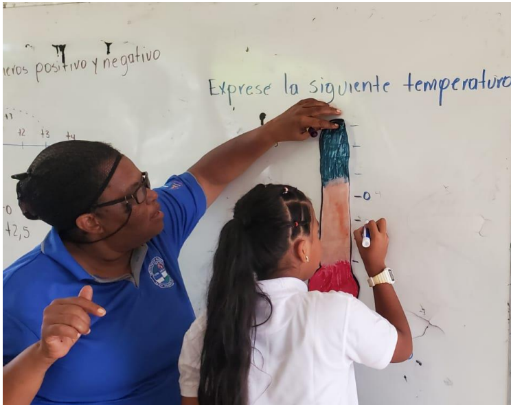
Estudiantes del séptimo grado Instituto, intervención del Plan de Acción